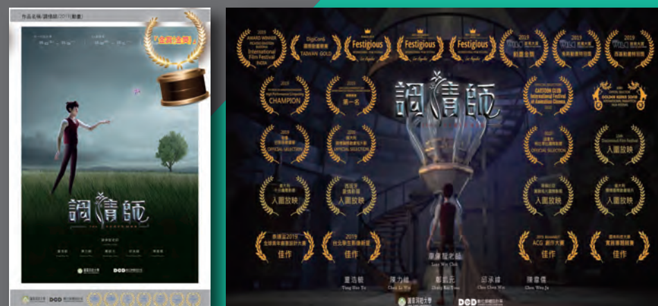
● 「調情師」3D 動畫學生作品屢創佳績，榮獲國內外多項比賽金獎、第一名、...等